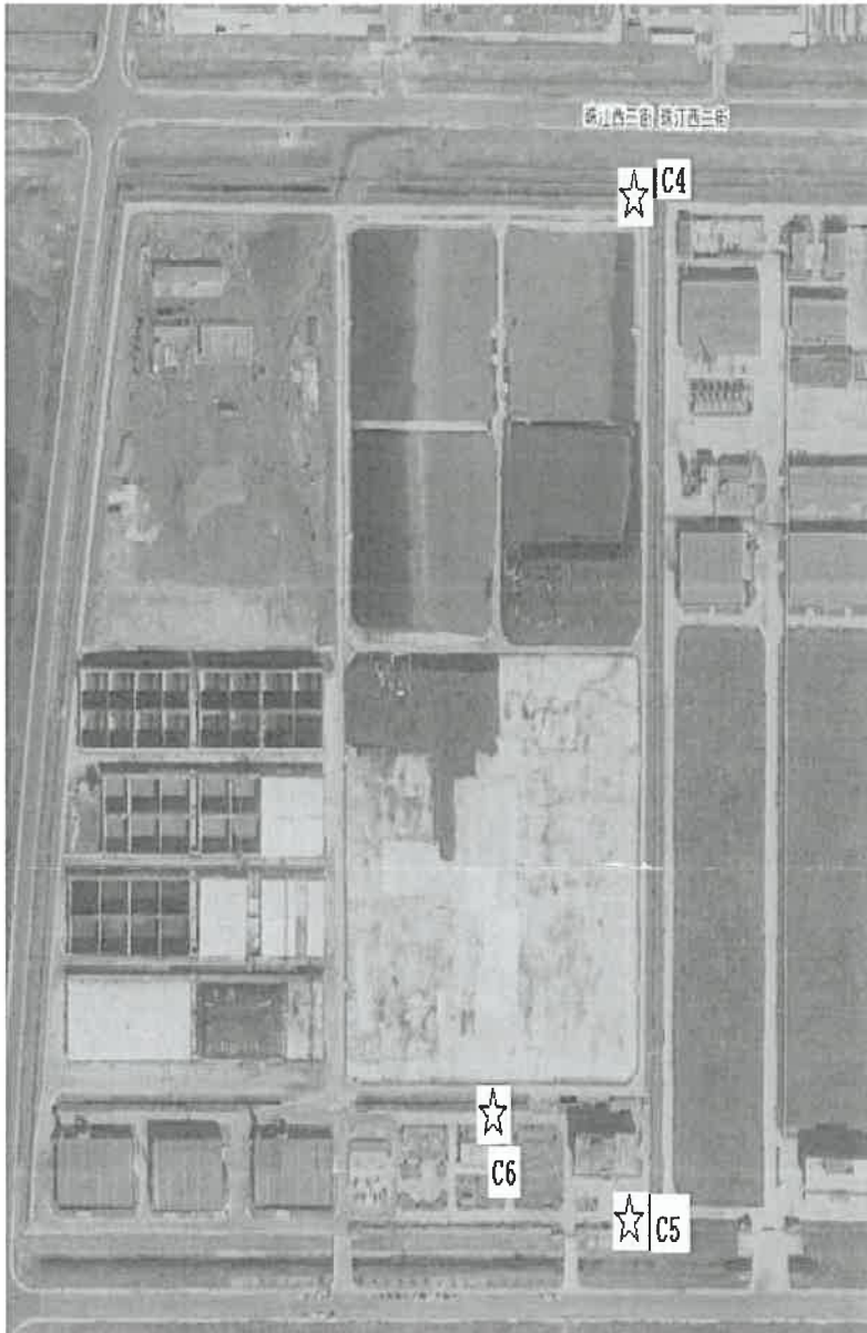
地下水检测点位示意图